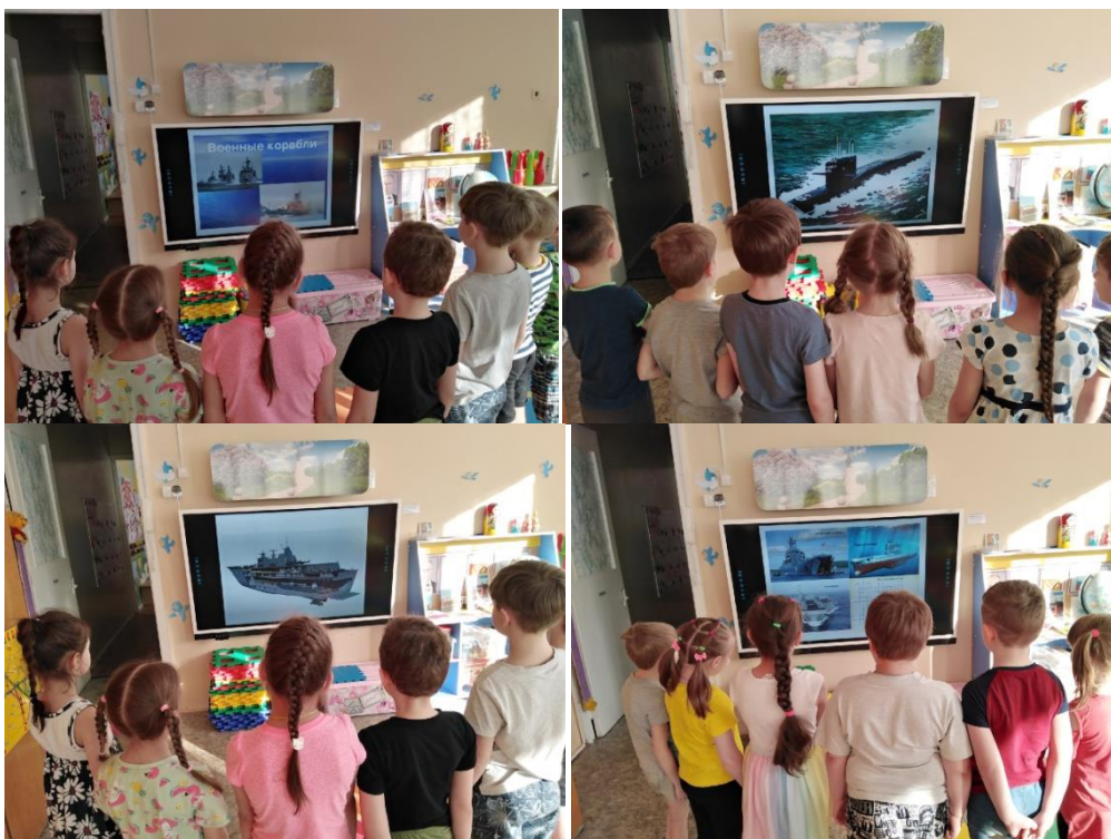
Знакомство с видами военных кораблей.