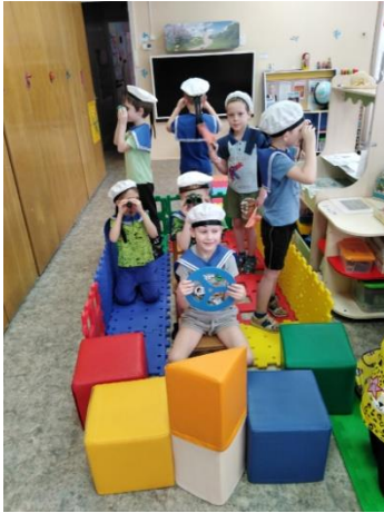
Сюжетно – ролевая игра «Морской поход».