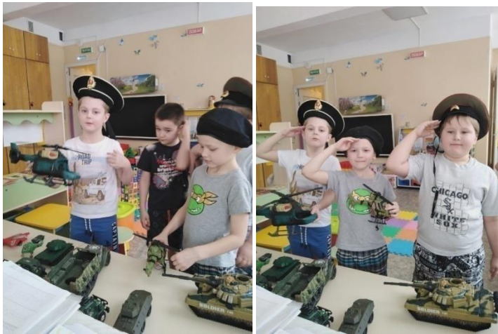
Обследование военной техники.