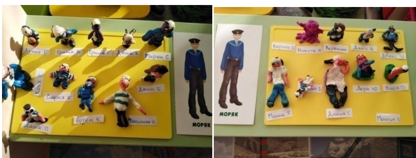
Лепка «Наши моряки».