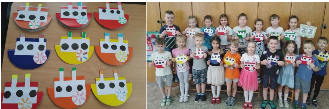
«Пароходы» - подарки папам и дедушкам к 23 февраля.