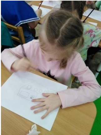
Рисование «Военные корабли на рейде».