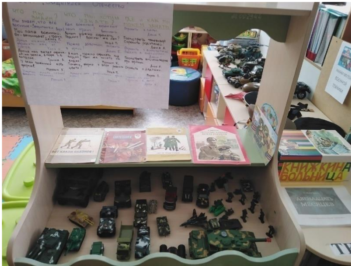
Выставка военной техники.