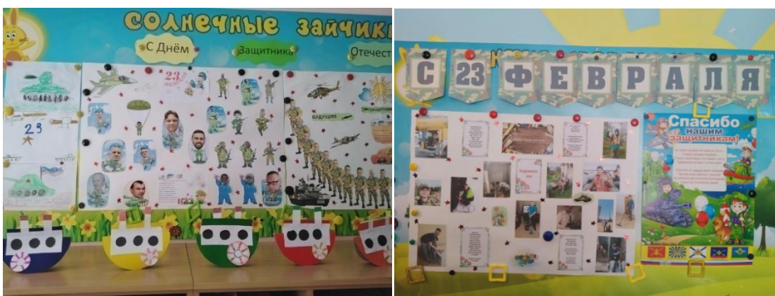
Стенгазета «Наши дедушки и папы» /с фотографиями/.